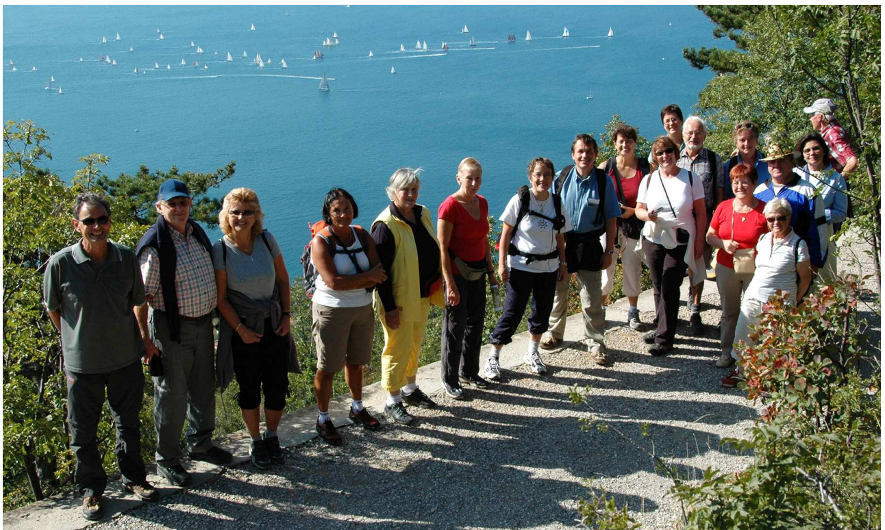
Obige Fotos: Erhard Berger